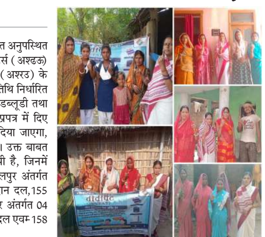
रहने को बताया गया है। मतदान केंद्र के करीब दो सौ मीटर तक की परिधि में मतदान, मतदान कर्मी, मतदान अधिकर्ता, पुलिस बल एवं मतदान बजे तक पोलिंग एजेंट की मौजूदगी में मौक पोल करवा लेने एवं प्रत्येक 2 घंटे पर सेक्टर को तथा कंट्रोल रूम को मतदान प्रतिशत से अवगत कराते

भागलपुर। 26 लोकसभा निर्वाचन क्षेत्र के अंतर्गत अनुपस्थित होने वाले अनुपस्थित वोटर दिव्यांग पीडब्लूडी वोटर्स ( अशरक) एवं 85 वर्ष से अधिक उम्र वाले वरिष्ठ नागरिकों ( अशरउ) के मतदान हेतु 17 अप्रैल एवं 18 अप्रैल 2024 को तिथि निर्धारित की गई है। इसके लिए अनुपस्थित होने वाले पीडब्लूडी तथा 85 वर्ष से ऊपर के मतदाता द्वारा भरे 12 डी प्रपत्र में दिए गए मोबाइल नंबर पर एसएमएस द्वारा मैसेज दिया जाएगा, या संबंधित बीएलओ द्वारा सूचित किया जाएगा। उक्त बातमें हेतु कुल 34 मतदान दलों की नियुक्ति की गयी है, जिनमें 152 बिहपुर अंतर्गत 6 मतदान दल, 153 गोपालपुर अंतर्गत 07 मतदान दल, 154-पीरपैती अंतर्गत 4 मतदान दल, 155 कहलगांव अंतर्गत 6 मतदान दल, 156 भागलपुर अंतर्गत 04 मतदान दल, 157 सुल्तानगंज अंतर्गत 04 मतदान दल एवम् 158 नाथनगर अंतर्गत 3 मतदान दल बनाया गया है।