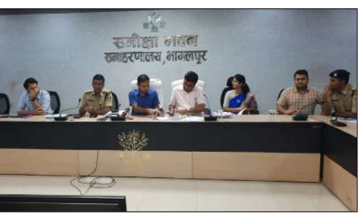
गई है। वहीं प्रशिक्षक द्वारा वीवीपेट के करीब दो सौ मीटर तक की परिधि में मतदान, मतदान कर्मी, मतदान अधिकर्ता, पुलिस बल एवं मतदान बजे तक पोलिंग एजेंट की मौजूदगी में मौक पोल करवा लेने एवं प्रत्येक 2 घंटे पर सेक्टर को तथा कंट्रोल रूम को मतदान प्रतिशत से अवगत कराते

भागलपुर। लोकसभा आम निर्वाचन 2024 को स्वतंत्र, शांतिपूर्ण, निष्पक्ष व भयमुक्त वातावरण में संपन्न करने को लेकर जिले के कुल 3416 मतदान पदाधिकारी को द्वितीय चरण में प्रशिक्षण दिया गया है। प्रशिक्षक द्वारा प्रथम, द्वितीय एवं तृतीय मतदान पदाधिकारी को प्रशिक्षण हेतु शामिल किया गया है। प्रशिक्षक द्वारा सभी पदाधिकारी को मतदान करने के लिए द्वितीय चरण में प्रशिक्षण दिया गया। इस दौरान प्रशिक्षक द्वारा ईवीएम संचालन से संबंधित अन्य तकनीकी जानकारी दी गई। साथ ही सीयू से वीयू एवं वीवीपेट को जोड़ने की भी तकनीकी जानकारी दी गई है। साथ ही वीवीपेट से संबंधित जानकारी दी