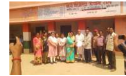
चंद्रा ने मध्य विद्यालय दीवानी टोला के प्रधानाध्यापक को विद्यालय का प्रभार आम संलग्न कर को सौंप दिया। इसके साथ ही दोनों विद्यालय एक हो गए। दोनों विद्यालय के एक होने पर मध्य विद्यालय के 202 छात्र एवं प्राथमिक विद्यालय के 120 छात्र कुल 322 छात्रों की शिक्षा मध्य विद्यालय दीवानी टोला के नेतृत्व में होगी। विदित हो कि प्राथमिक विद्यालय त्रिवेणी यादव टोला का संचालन मध्य विद्यालय दीवानी टोला में ही हो रहा था। लेकिन दोनों ही विद्यालयों का संचालन अलग-अलग किया जा रहा था।

बरियारपुर (मुंगेर)। शिक्षा विभाग की उदासीनता के कारण भवनहीन प्राथमिक विद्यालय का विलय बगल के विद्यालय में कई माह पूर्व बीते हुए वर्ष में हो जाना था। बार-बार प्राथमिक विद्यालय त्रिवेणी यादव टोला रहिया विद्यालय का अंग संलग्न कर को सौंप दिया। इसके साथ ही दोनों विद्यालय एक हो गए। दोनों विद्यालय के एक होने पर मध्य विद्यालय के 202 छात्र एवं प्राथमिक विद्यालय के 120 छात्र कुल 322 छात्रों की शिक्षा मध्य विद्यालय दीवानी टोला के नेतृत्व में होगी। विदित हो कि प्राथमिक विद्यालय त्रिवेणी यादव टोला का संचालन मध्य विद्यालय दीवानी टोला में ही हो रहा था। लेकिन दोनों ही विद्यालयों का संचालन अलग-अलग किया जा रहा था।