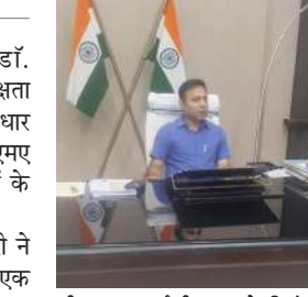
बीएमएसआईसीएल को निरंतर पर लिखा जाय, ताकि साक्ष्य आपके पास उपलब्ध रहे, वहीं उन्होंने सुरक्षा के संबंध में ध्यान केंद्रित कर कहा कि सिक्वोरिटी गार्ड को निर्देशित किया जाय की सुरक्षा व्यवस्था में चुक हुई तो उन्हें टर्मिनेट किया जायेगा, साथ ही पूरे परिसर में सीसीटीवी लगवाया जाय और यदि कहीं असामाजिक तत्व दिखाई देते हैं, तो उनका फुटेज जिला