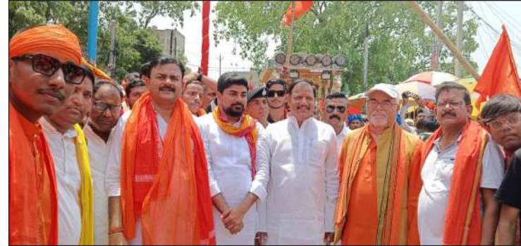
शोभायात्रा के दौरान तारापुर थाना क्षेत्र के बिहमा वगीचा से तारापुर सुल्तानगंज सड़क मार्ग के रास्ते रत्नेश्वर नाथ महादेव रणगांव तक बजरंग दल, आरएसएस, एवं भाजपा के कार्यकर्ताओं ने भगवान राम का भव्य शोभायात्रा निकालकर हसोउल्लास के साथ जय श्री राम जय श्री राम एवं घर-घर भगवा आएका का उद्घोष के साथ श्री राम का जन्म दिवस मनाया।

तारापुर। रामनवमी के एक रोज पूर्व बुधवार के दिन तारापुर थाना क्षेत्र के बिहमा वगीचा से तारापुर सुल्तानगंज सड़क मार्ग के रास्ते रत्नेश्वर नाथ महादेव रणगांव तक बजरंग दल, आरएसएस, एवं भाजपा के कार्यकर्ताओं ने भगवान राम का भव्य शोभायात्रा निकालकर हसोउल्लास के साथ जय श्री राम जय श्री राम एवं घर-घर भगवा आएका का उद्घोष के साथ श्री राम का जन्म दिवस मनाया।