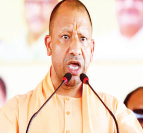
जिले के बिलारी में एक चुनावी रैली को संबोधित कर रहे थे।

लखनऊ, एजेंसी। उत्तर प्रदेश के मुख्यमंत्री योगी आदित्यनाथ ने शुक्रवार को कांग्रेस पार्टी पर बड़ा हमला बोला है। उन्होंने कहा है कि कांग्रेस अल्पसंख्यकों को गोमांस खाने का अधिकार देना चाहती है और यह गोहत्या की अनुमति देने के समान है। एक चुनावी सभा को संबोधित करते हुए योगी ने कहा, ये बेशर्म लोग गोमांस खाने का अधिकार देने का वादा करते हैं, जबकि हमारे ग्रंथ गाय को माता कहते हैं। वे गायों को कसाई के हाथों में सौंपना चाहते हैं। क्या भारत इसे कभी स्वीकार करेगा?