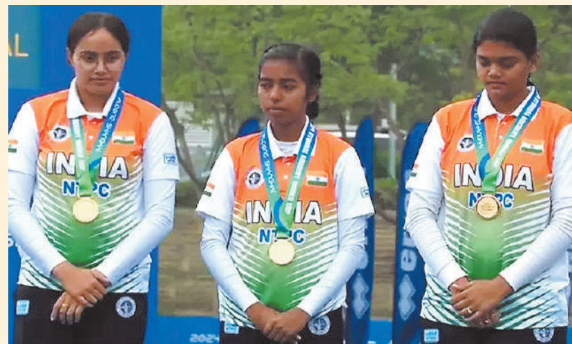
आर्ची वर्ल्ड कप