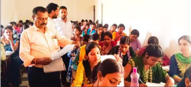
पालियों में सभी परीक्षार्थियों की संख्या सूची 1920 थी। जहां छठे दिन संचालित परीक्षा