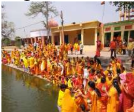
विधि व्यवस्था बनाए रखने में अमैठी