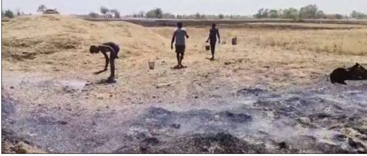
बारे में ग्रामीणों ने बताया की विद्युत तार स्पार्किंग की वजह से चिंगारी से आग लग गई और बाजार में तेज हवा के कारण देखते ही देखते आग ने भयावह रूप ले लिया। घटना के बाद ग्रामीणों

आग पर काबू पाने के लिए मुरारपुर, मोहनपुर, डिहरा, दुआरी, बडीही, मधीरा आदि गाँवों के बंधार में देखते ही देखते आग फैल गया। जिसमें गेहूँ और चना के फसल के अलावा पुआल कि ढेर भी जलकर खाक हो गया। आग पर काबू पाने के लिए बड़े छोटे चार वाहन दमकल वाहन पहुंचा तो आग पर नियंत्रण किया गया। घटना के