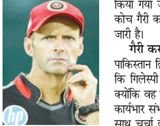
पाकिस्तान क्रिकेट बोर्ड (पीसीबी) ने इस महीने के अंत में न्यूजीलैंड के खिलाफ घरेलू टी20 मैचों की सीरीज के लिए चयन समिति के सदस्य मोहम्मद युसुफ को अंतरिम हेड कोच नियुक्त करने का फैसला किया है। वहीं, अबदुल

लाहौर, एजेंसी। 18 अप्रैल से न्यूजीलैंड क्रिकेट टीम के पाकिस्तान दौरे की शुरुआत होने जा रही है। दोनों टीमों के बीच 5 मैचों की टी20 सीरीज खेले जाएगी। इस सीरीज से पहले पाकिस्तान की टीम अपना कप्तान बदल चुकी है। बाबर आजम एक बार फिर वाइट बॉल क्रिकेट में पाकिस्तान की कप्तान संभालेंगे। वहीं, अब पीसीबी ने इस टी20 सीरीज के लिए हेड कोच के नाम का ऐलान भी कर दिया है।