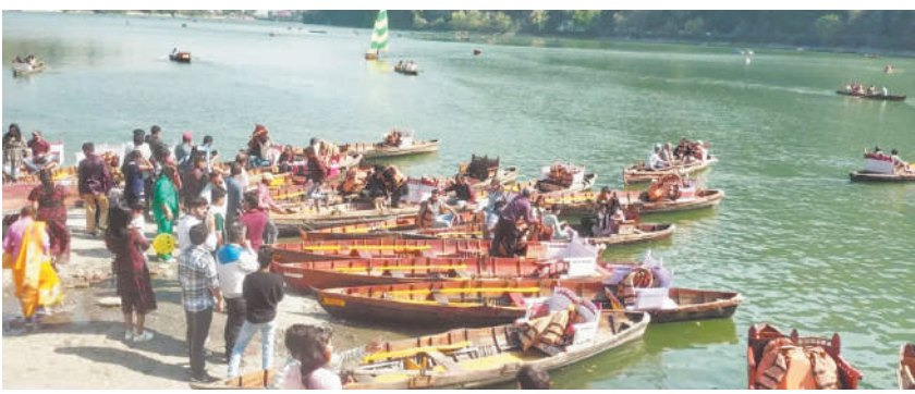
निखार नजर आया।

नैनीताल, एजेंसी। गर्मियां शुरू होने के साथ ही उत्तराखंड में सैलानी उमड़ने लगे हैं। खासकर सरोवर नगरी नैनीताल में पर्यटकों की भीड़ उमड़ रही है। वहीं इस बार वीकेंड आया तो नैनीताल में पर्यटकों की बहार साथ लेकर आया। इस वीकेंड पर भी सरोवर नगरी में पर्यटकों की भीड़ उमड़ पड़ी तो कारोबारी भी उत्साहित हो उठा। दरअसल वीकेंड का प्रचलन करीब डेढ़ दशक पहले शुरू हुआ, जो नगर की रंगत बढ़ा जाता है और पर्यटन कारोबारियों की आय में भी खासा बढ़ोतरी कर जाता है। कारोबारियों को उम्मीद है कि हिन्दू नववर्ष नौ नवंबर तथा 11 दिसंबर को ईद के बाद पर्यटकों की भीड़ और बढ़ेगी। शुक्रवार शाम से पर्यटकों का आना शुरू हुआ, जो शनिवार व रविवार दोपहर तक जारी रहने की संभावना है। जिस कारण नगर के होटलों के अधिकांश कमरे पैक हो चले हैं। पार्किंग स्थल पर्यटक वाहनों से पट गई। इस बीच नगर के बाजार पर्यटकों से पटे नजर आए, पर्यटन स्थलों में पूरे दिन भारी भीड़ रही। सोज्यो, राजभवन, चिड़ियाघर, हिमालय दर्शन व केव गार्डन में काफी चहल पहल रही। बड़ी संख्या में आवाजाही रही। सैलानियों ने झील में नौकायन का लुफ्त उठाकर सैरसपाटे को यादगार बनाया। मालरोड की रौनक में