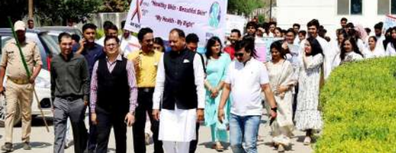
प्रातः किरण संवाददाता