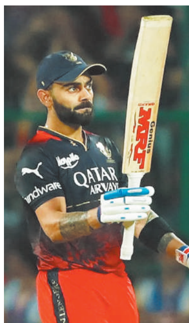
विराट कोहली ने राजस्थान के खिलाफ 72 गेंदों का सामना किया और वो इस लीग में एक पारी में सबसे ज्यादा गेंद फेंस करने वाले बल्लेबाजों की लिस्ट में दूसरे नंबर पर आ गए। उन्होंने डीकोक और केएल राहुल को पीछे छोड़ दिया जो इस लिस्ट में संयुक्त रूप से पहले दूसरे नंबर पर थे, लेकिन

जयपुर, एजेंसी। आरसीबी के स्टार बल्लेबाज विराट कोहली का शानदार फॉर्म आईपीएल 2024 में जारी है। उन्होंने अपनी टीम के लिए राजस्थान रॉयल्स के खिलाफ शतक लगाया और उनकी इस पारी के दम पर आरसीबी ने 20 ओवर में 3 विकेट पर 183 रन बनाए। कोहली इस सीजन में शतक लगाने वाले पहले बल्लेबाज बने और ये उनके आईपीएल क्रिकेट करियर का 8वां तो वहीं टी20 क्रिकेट करियर का 9वां शतक भी रहा। कोहली ने इस मैच में बेशक अपनी टीम के लिए नाबाद 113 रन की पारी खेली, लेकिन एक शर्मनाक रिकॉर्ड उनके नाम पर दर्ज हो गया। आईपीएल में सबसे स्लो शतक लगाने वाले बल्लेबाज बने कोहली - राजस्थान के खिलाफ कोहली ने 72 गेंदों पर 4 छक्के और 12 चौकों को मदद से