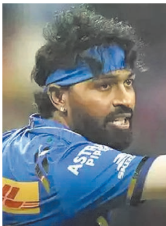
हार्दिक पंड्या को स्वतंत्र रूप से काम नहीं करने दे रहा - हरभजन ने मैच के बाद कहा- दृश्य अच्छे नहीं लग रहे हैं। उन्हें अकेला छोड़ दिया गया है। फ्रेंचाइजी के खिलाड़ियों को उन्हें अपने कप्तान के रूप में स्वीकार करना चाहिए। निर्णय लिया जा चुका है और टीम को एक साथ रहना चाहिए। इस फ्रेंचाइजी के लिए खेलने के बाद स्थिति अच्छी नहीं दिख रही है। एमआई के पूर्व स्टार अंबाती रायडु ने पूछ कि क्या टीम के सदस्य हार्दिक को

पर गुस्सा जाहिर किया। रविवार को राजस्थान रॉयल्स के खिलाफ हार के बाद हार्दिक को डगआउट में अकेले बैठे देखा गया। इस एक तस्वीर ने हरभजन को नाराज कर दिया। पूर्व क्रिकेटर ने कहा कि हार्दिक को अकेला छोड़ दिया गया है और टीम और कप्तान के फैसले को लेकर स्थिति अच्छी नहीं दिख रही है। हार्दिक पंड्या को स्वतंत्र रूप से काम नहीं करने दे रहा - हरभजन ने मैच के बाद कहा- दृश्य अच्छे नहीं लग रहे हैं। उन्हें अकेला छोड़ दिया गया है। फ्रेंचाइजी के खिलाड़ियों को उन्हें अपने कप्तान के रूप में स्वीकार करना चाहिए। निर्णय लिया जा चुका है और टीम को एक साथ रहना चाहिए। इस फ्रेंचाइजी के लिए खेलने के बाद स्थिति अच्छी नहीं दिख रही