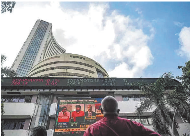
हैसियत घट गई। सप्ताह के दौरान देश की दूसरी सबसे बड़ी टेलिकॉम कंपनी भारतीय जीवन बीमा निगम की बाजार

नई दिल्ली, एजेंसी। पिछले हफ्ते शोयर बाजार में केवल चार दिन कारोबार हुआ। महाशिवरात्रि के मौके पर शुक्रवार को शोयर बाजार में छुट्टी रही। गुरुवार को बीएसई सेंसेक्स 74,119.39 अंक के नए रिकॉर्ड स्तर पर बंद हुआ। उसी दिन नेशनल स्टॉक एक्सचेंज का निफ्टी भी 22,493.55 अंक के अपने सर्वकालिक उच्चस्तर पर बंद हुआ। इस दौरान सेंसेक्स की टॉप 10 मूल्यांकन कंपनियों में से सात के मार्केट कैप में कुल मिलाकर 71,301.34 करोड़ रुपये की बढ़ोतरी हुई। कम कारोबारी सत्रों के सप्ताह के दौरान सबसे अधिक लाभ में भारती एयरटेल रही। टाटा कंसल्टेंसी सर्विसेज, एचडीएफसी बैंक, आईसीआईसीआई बैंक, भारतीय स्टेट बैंक, भारती एयरटेल, हिंदुस्तान यूनिलीवर और आईटीसी के बाजार मूल्यांकन में बढ़ोतरी हुई, वहीं रिलायंस इंडस्ट्रीज, इन्फोसिस और भारतीय जीवन बीमा निगम की बाजार