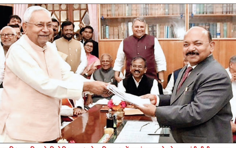
बिहार विधान परिषद के लिये विधानसभा के सचिव कक्ष में नामांकन करते हुए मुख्यमंत्री नीतीश कुमार