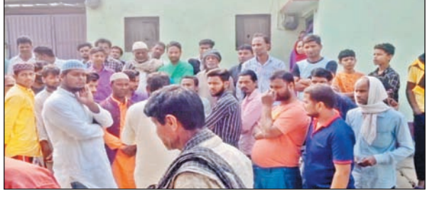
प्रातः किरण संवाददाता

बेतिया (प.च)। नगर पुलिस ने बुधवार की शाम नगर के बसवरिया टीओपी से महज 100 कदम की दूरी पर चंद्रावत नदी के किनारे झाड़ी से एक 8 वर्षीय बच्ची का शव बरामद किया है। सूत्रों के अनुसार बच्ची का अपहरण कर सामूहिक दुष्कर्म करने के बाद हत्या कर शव को छिपा दिया गया था। इस घटना से पूरे इलाके में सनसनी फैल गई और हड़कंप