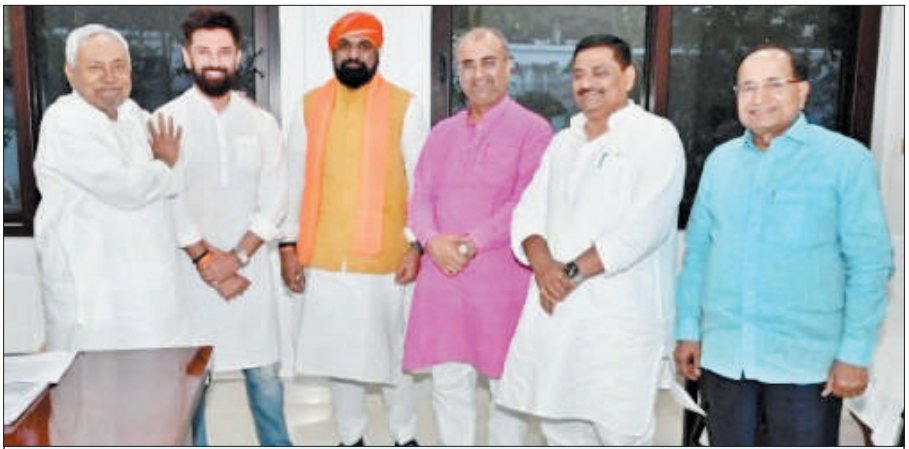
मुख्यमंत्री नीतीश कुमार से लोजपा रामविलास के राष्ट्रीय अध्यक्ष चिराग पासवान ने गुरुवार को मुलाकात की। मुलाकात के दौरान भाजपा के प्रदेश अध्यक्ष सम्राट चौधरी, स्वास्थ्य मंत्री मंगल पांडे, जदयू के राज्य सभा सांसद संजय झा व जदयू नेता संजय सर्राफ रहें मौजूद।