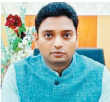
विषय की महत्ता को देखते हुए जिला दंडाधिकारी सह जिलाधिकारी द्वारा पुनः 01 से 06 अप्रैल 2024 तक शस्त्रों के सत्यापन कार्य कराने का निर्देश दिया गया है। उन्होंने बताया कि इस कार्य के लिए जिले

● 1757 शस्त्र अनुज्ञापितधारी में से मात्र 738 लाइसेंस गन का सत्यापन किया गया है शेष 821 लाइसेंस हथियार का सत्यापन के वास्ते जिला पदाधिकारी ने तारीख को आगे बढ़ाया