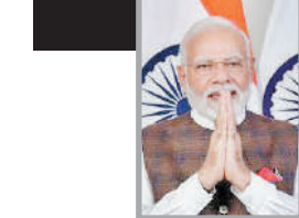
प्रधानमंत्री नरेन्द्र दामोदरदास मोदी भारत सरकार