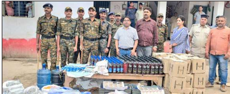
पटना सिटी, प्रातः किरण संवाददाता

40 लीटर स्प्रिट, रैपर, कार्क, बोटल आदि जेतुली से बरामद