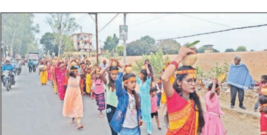
प्रातः किरण संवाददाता