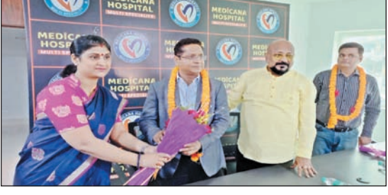
समस्तीपुर, प्रातः किरण संवाददाता