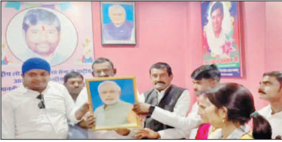
समस्तीपुर, प्रातः किरण संवाददाता