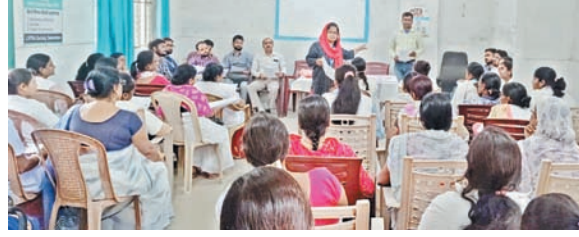
प्रातः किरण संवाददाता

मरीजों की जानकारी लेने के लिए जागरूक रहने की बात कही गई है। ताकि जांच करवा कर पता लगाया जा सके। ऐसी बीमारी से कोई पीड़ित है तो उसके बचाव का अभियान की बात कही है। मौके पर डॉ. मो. हैदर,