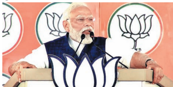
हिंदू महासागर क्षेत्र में समुद्री डकैती, आतंकवाद का मुकाबला करने को प्रतिबद्ध

सलेम (तमिलनाडु)। एंजेसी। प्रधानमंत्री नरेन्द्र मोदी ने कांग्रेस नेता राहुल गांधी की शक्ति वाली टिप्पणी को लेकर इंडिया गठबंधन पर हमला जारी रखते हुए मंगलवार को कहा कि विपक्षी गठबंधन ने इसे नष्ट करने की घोषणा कर अपने बुरे इरादे का प्रदर्शन किया है। मोदी ने यहां भाजपा की एक रैली को संबोधित करते हुए कहा कि कांग्रेस और द्रमुक बार-बार हिंदुत्व का अपमान करते हैं, लेकिन किसी अन्य धर्म को निशाना नहीं बनाते। कांग्रेस और द्रमुक विपक्षी इंडिया गठबंधन के अहम घटक हैं। प्रधानमंत्री ने कहा कि इंडिया गठबंधन के लोग जानबूझकर हिंदू आस्था का अपमान करते हैं और इसके खिलाफ उनके द्वारा हर बयान प्रेषित किया जा रहा है। उन्होंने कहा, इंडी अलायंस वाले लोग बार-बार, जानबूझकर हिंदू धर्म का अपमान करते हैं। हिंदू धर्म के खिलाफ इनका हर बयान बहुत सोचा समझा हुआ होता है। आप देखिए, और किसी धर्म का अपमान द्रमुक और कांग्रेस का इंडी अलायंस नहीं करता, किसी और धर्म के खिलाफ इनकी जुबान से एक शब्द नहीं निकलता। लेकिन हिंदू धर्म को गाली देने में ये एक सेकंड नहीं लगाते।