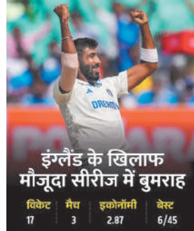
इंग्लैंड के खिलाफ मौजूदा सीरीज में बुमराह

धर्मशाला (एजेंसी)। तेज गेंदबाज जसप्रीत बुमराह को भारत और इंग्लैंड के बीच चल रही टेस्ट सीरीज के चौथे मुकामले से आराम दिया जा सकता है।