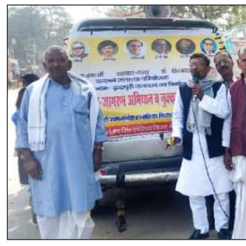
कहा कि शाहाबाद मगध क्षेत्रों को आकाल व सुखाड़ से हमेशा के लिए बचाने के लिए कदवन जलाशय परियोजना ही एक मात्र विकल्प है नहीं