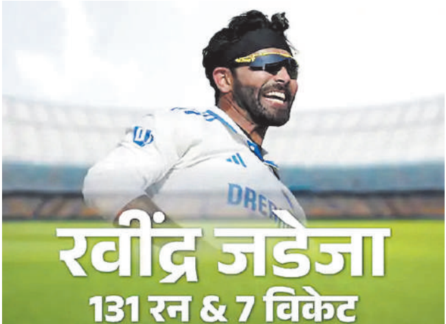
रवींद्र जडेजा 131 रन & 7 विकेट

राजकोट (एजेंसी)। भारत में बेअसर रहना बैजबॉल... भारतीय क्रिकेट विशेषज्ञों की यह भविष्यवाणी अब सही हो रही है। राजकोट में भारत की रन के लिहाज से सबसे बड़ी टेस्ट जीत (434 रन) ने इस बात की गवाही भी दे दी है। इस जीत से टीम इंडिया ने इंग्लैंड के खिलाफ 5 मैचों की सीरीज में 2-1 की बढ़त हासिल कर ली है। चौथा मुकामला रांची में 23 से 27 फरवरी के बीच खेला जाएगा। भारतीय प्लेयर्स ने पिछले 20 महीनों में इंग्लैंड को चमकाने वाले 'बैजबॉल' की हवा कैसे निकाली।