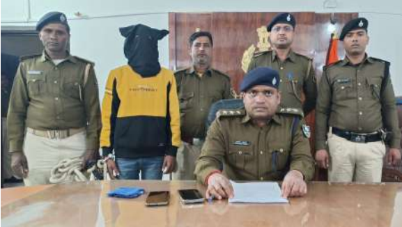
अपराधी को पुलिस ने गिरफ्तार कर लिया है। मिली सूचना के आधार

रक्सौल। भारत-नेपाल सीमा के रक्सौल में शिव शक्ति राईस मिल कर्मचारी से लूट और हत्याकांड मामले में पुलिस को एक बड़ी कामयाबी हाथ लगी है। पुलिस ने 20 हजार के ईनामी कुख्यात