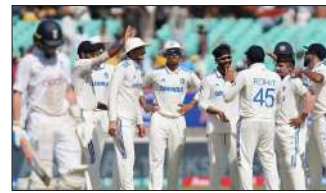
से मात दी थी। इसके अलावा 2008 में ऑस्ट्रेलिया के खिलाफ भारत ने मोहाली में 320 रन से जीत दर्ज की थी। भारत के खिलाफ तीसरे टेस्ट में इंग्लैंड को 434 रन

की टीम 122 रन बनाकर ऑल आउट हो गई। राजकोट में खेले गए टेस्ट मुकाबले में भारत ने सबसे बड़ी जीत दर्ज की है। इससे पहले न्यूजीलैंड के खिलाफ 2021 में खेले गए मैच में भारत ने 372 रन से जीत दर्ज की थी। वहीं, 2015 में दक्षिण अफ्रीका के खिलाफ भारत ने 337 रन से मुकाबला अपने नाम किया था। 2016 में टीम इंडिया ने न्यूजीलैंड को 321 रन