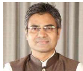
गया है। कुछ सीटों पर कांग्रेस चुनाव लड़ेगी, जबकि कुछ सीटों पर आप चुनाव लड़ेगी। लेकिन सच तो यह है कि हम साथ मिलकर चुनाव लड़ेंगे और इसमें INDIA जीतेगा। उन्होंने कहा कि इस गठबंधन के बाद बीजेपी की सारी रणनीति धरी की धरी रह जाएगी।