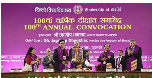
दिल्ली विश्वविद्यालय 100वां वार्षिक दीक्षांत समारोह 100th Annual Convocation का उद्घाटन कार्यक्रम हुआ। मुख्य अतिथि श्री जगदीप धनखड़, भारत के उप-राष्ट्रपति, ने भाषण दिया।

नई दिल्ली। भारत के उप राष्ट्रपति जगदीप धनखड़ ने नव ग्रेजुएट विद्यार्थियों से कहा कि विकसित भारत@2047 की कुंजी आपके पास है, इसे अनलॉक करें। उप राष्ट्रपति दिल्ली विश्वविद्यालय के 100वें दीक्षांत समारोह में बतौर मुख्यातिथि संबोधित कर रहे थे। उन्होंने अपने विस्तृत भाषण में कहा कि गणतंत्र के 75वें साल में ये शताब्दी दीक्षांत समारोह सिर्फ एक समारोह से कहीं आगे है। यह आप सभी के लिए एक लॉन्च पैड है। यह कुछ हद तक श्रीहरिकोटा में इसरो रॉकेट लॉन्च पैड के समान है। यह सुरक्षित लॉन्च पैड आपको न केवल नई मजिलों तक ले जाएगा,