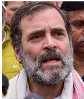
एक और गुजरात में दो सीट दी गई है। यूपी एमपी में सपा के बाद अब आप के साथ भी हुआ समझौता-कांग्रेस द्वारा सीट शेयरिंग के लिए गठित

लोकसभा चुनाव 2024 लंबे इंतजार और अटकलबाजियों के बाद शनिवार को आम आदमी पार्टी और कांग्रेस के बीच चुनावी गठबंधन की घोषणा कर दी गई है। आप को हरियाणा में एक और गुजरात में दो सीट- दिल्ली में आप चार और कांग्रेस तीन सीटों पर लड़ेगी। हरियाणा, गुजरात और गोवा में भी दोनों दल मिलकर लोकसभा चुनाव लड़ेंगे। आप को हरियाणा में