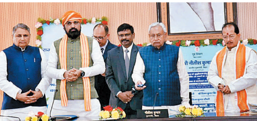
पुलिस पदाधिकारियों को 1220 स्मार्ट मोबाइल फोन किया गया प्रदान

पटना। मुख्यमंत्री नीतीश कुमार ने 1 अग्रे मार्ग स्थित संकल्प में रिमोट के माध्यम से बिहार पुलिस भवन निर्माण निगम द्वारा राज्य पुलिस एवं कारा व्यवस्था के सुदृढीकरण हेतु 459.52 करोड़ रुपये की लागत से नवनिर्मित 139 भवनों का उद्घाटन तथा 996.53 करोड़ रुपये की लागत से बननेवाले 192 भवनों का शिलान्यास किया। इस मौके पर मुख्यमंत्री नीतीश कुमार ने कहा कि बिहार पुलिस भवन निर्माण निगम बेहतरीन कार्य कर रहा है। उन्होंने कहा कि जिन योजनाओं का शिलान्यास कराया गया है और जो भी बचे हुए कार्य हैं उसे तेजी से पूर्ण करें। सभी पुलिस थानों एवं पुलिस भवनों के ऊपर सोलर प्लेट लगाए ताकि सौर ऊर्जा का वहां उपयोग हो सके। सभी पुलिस भवनों एवं थानों को पेंट न करें। पुलिस भवन एवं थाना में साफ-सफाई की बेहतर व्यवस्था रखें। उन्होंने अधिकारियों को निर्देश दिया कि पुलिस गश्ती निरंतर हो, इसे सुनिश्चित करें। गड़बड़ी करनेवालों पर सख्त कार्रवाई करें। उल्लेखनीय है कि मुख्यमंत्री नीतीश कुमार के नेतृत्व एवं निर्देशन में राज्य के विकास के लिए कई महत्वपूर्ण कार्य किए गए हैं। बिहार पुलिस भवन निर्माण निगम द्वारा कई पुलिस भवनों