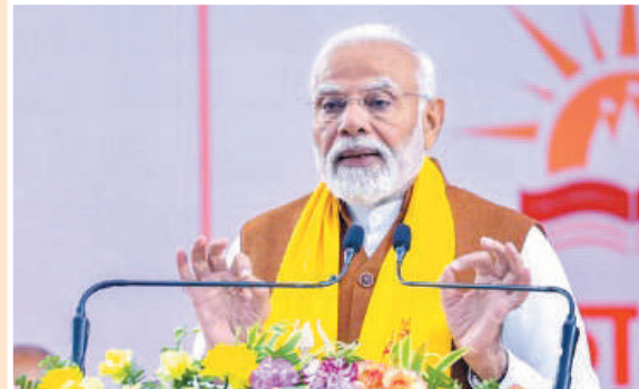
भरोसा रखने वाले ईडी गठबंधन के लोग दलितों वंचितों के लिए

इन्होंने विधाओं से भारत को पहचान मिली है। जिन वेदों का पाठ काशी में होता है वही वेद पाठ कांची में भी सुनाई देता है। ये वेद ही भारत का शाश्वत स्वर हैं, जिन्होंने हजारों वर्ष से भारत को राष्ट्र के रूप में एक बनाए रखा है। परिवारवादी दल दलित, पिछड़ों को आगे नहीं बढ़ना देना चाहते: वाराणसी। प्रधानमंत्री नरेन्द्र मोदी ने शुक्रवार को कहा कि देश को जाति के नाम पर उकसाने और लड़ने में