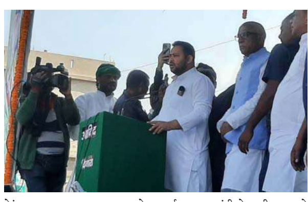
केन्द्र तथा राज्य सरकार पर बरसे। पूर्व उपमुख्यमंत्री तेजस्वी यादव ने

● कहा मैं दो-दो मुख्यमंत्री का बेटा हूँ और दो बार उपमुख्यमंत्री और विरोधी दल का नेता भी रह चुका हूँ इसलिए मुझे कुर्सी नहीं चाहिए मैं जनता की सेवा करना चाहता हूँ