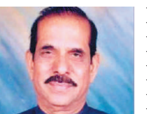
पर शुक्रवार को गहरा शोक व्यक्त किया है। पीएम ने कहा कि उन्होंने स्थानीय स्तर से लेकर राष्ट्रीय स्तर तक विभिन्न जिम्मेदारियों को निभाते हुए महाराष्ट्र की प्रतिष्ठित के लिए अथक प्रयास किया। प्रधानमंत्री ने सोशल मीडिया मंच एक्स लिखा, मनोहर जोशी जी के निधन से दुखी हूँ। वह एक अनुभवी नेता थे जिन्होंने सार्वजनिक सेवा में वर्षों बिताए और नगरपालिका, राज्य और राष्ट्रीय स्तर पर विभिन्न जिम्मेदारियों

मुंबई/एजेंसी। महाराष्ट्र के पूर्व मुख्यमंत्री एवं लोकसभा के पूर्व अध्यक्ष मनोहर जोशी का शुक्रवार को दिल का दौरा पड़ने से निधन हो गया। वह 85 वर्ष के थे। पार्टी सूत्रों ने यह जानकारी दी। श्री जोशी को बुधवार को पी डी हिंदुजा अस्पताल में भर्ती कराया गया था। वह गहन चिकित्सा कक्ष आईसीयू में थे। आज तड़के तीन बजे उनका निधन हो गया। अंतिम दर्शन के लिए पार्थिव शरीर को माटुंगा स्थित उनके घर पर रखा गया है। उनका अंतिम संस्कार शिवाजी पार्क श्मशान घाट पर किया जाएगा। पीएम व सीएम ने जताया शोक: नई दिल्ली। प्रधानमंत्री नरेन्द्र मोदी व मुख्यमंत्री नीतीश कुमार ने लोकसभा के पूर्व अध्यक्ष मनोहर जोशी के निधन