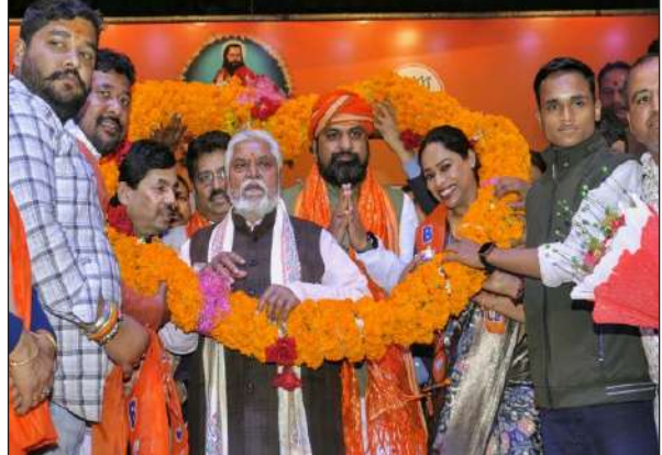
वे कहते थे कि जन्म से कोई व्यक्ति किसी जाति में जन्म ले सकता है, लेकिन अगर ज्ञान अर्जित कर लिया तो वह पंडित से भी आगे बैठने का हकदारी बन जाता है। उन्होंने साफ लहजे में कहा कि जब तक पिछड़े

पीएम मोदी के नेतृत्व में आगे बढ़ रहा सनातन : सम्राट भाजपा ने मनाई संत शिरोमणि संत रविदास जयंती प्रतःकिरण संवाददाता पटना। बिहार भाजपा द्वारा आज पटना के श्रीकृष्ण मेमोरियल हॉल में संत शिरोमणि रविदास जयंती समारोह का आयोजन किया गया। इस मौके पर भाजपा के प्रदेश अध्यक्ष और उप मुख्यमंत्री सम्राट चौधरी ने कहा कि संत रविदास ने समाज की दूरियों को दूर करने का प्रयास किया। उन्होंने कहा कि सनातन पीर उस दौर में संत रविदास के पास उनका धर्म परिवर्तन करने पहुंचा थे, लेकिन वह रविदास जी से इतने प्रभावित हुए कि उन्होंने ही सनातन स्वीकार कर ली। उन्होंने कहा कि प्रधानमंत्री नरेंद्र मोदी के नेतृत्व में सनातन आगे बढ़ रहा है। समाज के एक एक वर्गों को आगे बढ़ाने का काम किया जा रहा है। उप मुख्यमंत्री ने संत रविदास के वचनों को उद्धृत करते हुए कहा कि