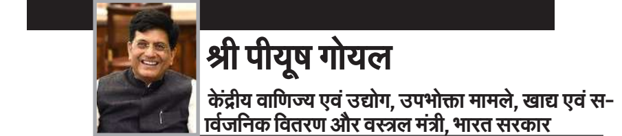
श्री पीयूष गोयल केंद्रीय वाणिज्य एवं उद्योग, उपभोक्ता मामले, खाद्य एवं स-र्वजनिक वितरण और वस्त्रल मंत्री, भारत सरकार

10 लाख से एक करोड़ रुपए तक की आय पर मदिरों को 5 फीसदी टैक्स देना होगा। एक करोड़ रुपए से ज्यादा आय वाले मदिरों को 10 फीसदी टैक्स राज्य सरकार को देना होगा। जैसे ही यह बिल पारित हुआ। उसके बाद भारतीय जनता पार्टी ने कर्नाटक सरकार और कांग्रेस के खिलाफ मोर्चा खोल दिया। सारे देश के हिंदू संगठन कर्नाटक सरकार की इस कार्रवाई के खिलाफ खड़े हो गए। भारतीय जनता पार्टी ने इसे हिंदू विरोधी मानसिकता बताते हुए, सारे देश में इस टेक्स का विरोध करना शुरू कर दिया है। सोशल मीडिया में भी कर्नाटक सरकार के इस कानून का बड़े पैमाने पर विरोध शुरू कर दिया गया है। कांग्रेस के उम्र आरोप लगाया जा रहा है, कि अब कांग्रेस की हिंदू मदिरों के राजस्व पर कूटनिष्ठ पड़ गई है। ऐसा लगता है कि कांग्रेस नेताओं की या तो राजनीतिक समझ खत्म हो गई है, या जानबूझकर कांग्रेस के नेता पार्टी को टिकाने लगाने, हर वह कोशिश कर रहे हैं। जो पार्टी को नेस्त-नाबूत कर दे। कुछ महीनों के पश्चात लोकसभा के चुनाव होना है। राम मंदिर की प्राण प्रतिष्ठा के बाद भारतीय जनता पार्टी द्वारा एक बड़ा अभियान चलाया जा रहा है। दक्षिण के राज्यों में प्रधानमंत्री नरेंद्र मोदी ने स्वयं जाकर राम मंदिर के नाम पर धार्मिक वातावरण बनाने का प्रयास किया। भारत में धार्मिक धुवीकरण को लेकर जब इतनी बड़ी राजनीति चल रही हो। ऐसे समय पर कांग्रेस का यह कदम आत्मघाती ही माना जाएगा। ग्रामीण जनों की भाषा में कहें ,तो कांग्रेस अपने पैर में कुल्हाड़ी नहीं कुल्हाड़ा मारकर अपना स्थाई नुकसान करती है।