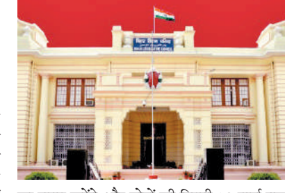
का चयन करेंगे और वोटों की गिनती 23 मार्च तक पूरी करनी होगी। वहीं जरूरत पड़ने पर 21 मार्च को मतदान की तिथि निर्धारित की गई है। सुबह नौ बजे से शाम चार बजे तक वोटिंग का समय तय किया गया है। मतदान के बाद उसी दिन मतगणना की तिथि भी निर्धारित की गई। शाम पांच बजे से मतगणना होगी और देर शाम तक चुनाव परिणाम की घोषणा कर दी जाएगी। चुनाव प्रक्रिया 23 मार्च तक पूरी

पटना। बिहार में विधान परिषद की 11 सीटों के लिए चुनाव आयोग की ओर से चुनाव की घोषणा कर दी गई है। मुख्यमंत्री नीतीश कुमार और राबड़ी देवी समेत 11 सदस्यों का कार्यकाल पूरा हो रहा है। सीएम नीतीश और राबड़ी देवी समेत 11 सदस्यों का कार्यकाल 6 मई को पूरा हो रहा है। इससे पहले चुनाव आयोग की ओर से चुनाव प्रक्रिया पूरी कर ली जाएगी। चुनाव के लिए अधिसूचना 4 मार्च को जारी की जाएगी और 11 मार्च तक नामांकन पत्र दाखिल करना होगा। नामांकन पत्र वापस लेने की अंतिम तिथि 14 मार्च है। बिहार विधानसभा के सदस्य 21 मार्च को इन 11 सीटों के लिए उम्मीदवारों