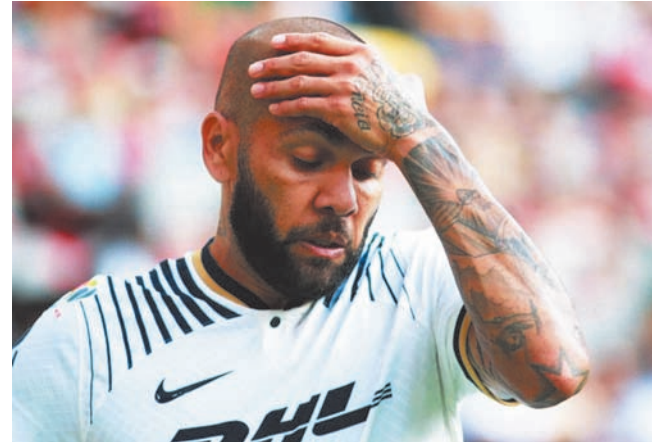
यौन उत्पीड़न का मामला