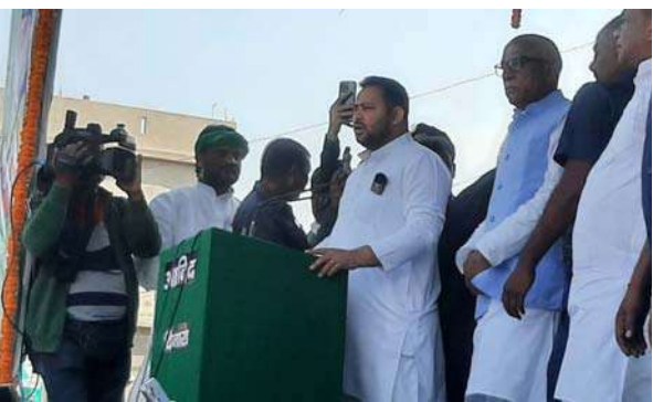
केन्द्र तथा राज्य सरकार पर बरसे। पूर्व उपमुख्यमंत्री तेजस्वी यादव ने

सासाराम। रोहतास जिले के दिनार स्थित बलदेव उच्च विद्यालय में जन विश्वास यात्रा के तहत पहुंचे पूर्व उपमुख्यमंत्री तेजस्वी यादव ने जमकर