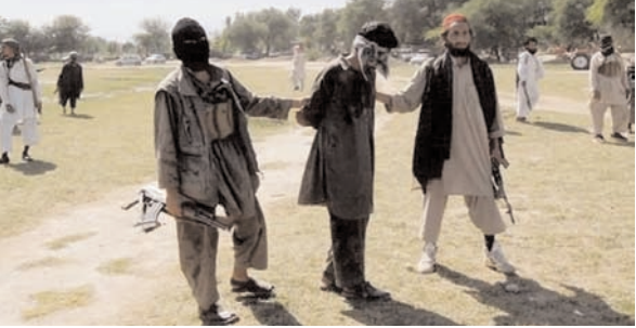
देखने के लिए तालिबानी सरकार के आदेश पर हजारों लोग स्टेडियम में एकत्र हुए थे। दोषी व्यक्तियों के पीड़ितों के परिवार उपस्थित थे और उनसे पूछा गया कि क्या वे अंतिम समय में अपने परिजनों के लिए कुछ कहना चाहते हैं लेकिन उन्होंने कुछ भी कहने से इनकार कर दिया। गौरतलब है कि काबुल में 2021 में सत्ता संभालने और