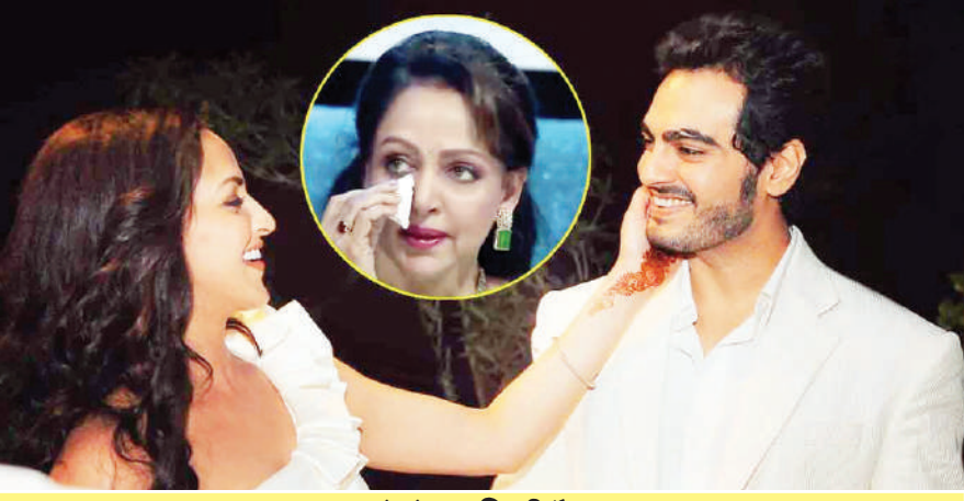
यह दोनों का निजी फैसला