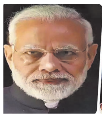
सब्सिडी देने की गुजारिश

नई दिल्ली, एजेंसी। प्रधानमंत्री नरेंद्र मोदी ने बीते दिनों रूफटॉप सोलर स्कीम का ऐलान किया है। इस नई स्कीम से 1 करोड़ घरों को मुफ्त बिजली का फायदा मिलेगा। स्कीम पर सरकार 75,000 करोड़ रुपये से ज्यादा का निवेश करेगी। इसका मकसद हर महीने 300 यूनिट तक मुफ्त बिजली की पेशकश करके एक करोड़ घरों को रोशन करना है। स्कीम के तहत सरकार लाभार्थियों के बैंक खातों में सीधे सब्सिडी डालेगी। मोदी सरकार की इस फेवरेट योजना के लिए अब अमेरिका की टेक्ना जकार निर्माता कंपनी टेस्ला इंक पार्टनर की तलाश कर रही है। मोडिया रिपोर्ट्स के मुताबिक, एलन मस्क की अगुवाई वाली टेस्ला ने सरकार को अपनी योजनाओं के बारे में पहले ही बता दिया था।