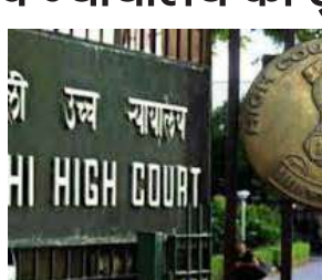
उच्च न्यायालय के प्राधिकारियों ने मामले को विस्तृत जांच करने और जल्द से जल्द एक रिपोर्ट सौंपने की मांग की है।