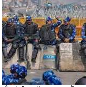
और कंक्रटी ब्लॉक लगाए गए हैं।

किसानों के दिल्ली चलो आंदोलन का बृहस्पतिवार को तीसरा दिन है और दिल्ली व हरियाणा के बीच दो प्रमुख सीमाओं पर वाहनों की आवाजाही बंद है, जबकि राष्ट्रीय राजधानी में महत्वपूर्ण स्थानों पर दंगा रोधी सुरक्षाकर्मी तैनात किए गए हैं। हरियाणा से लगी दो सीमाएं झ टिकरी और सिंधु झ बंद हैं जबकि उत्तर प्रदेश से लगी गाजीपुर सीमा पर सुरक्षा कर्मियों की निगरानी में आवाजाही की अनुमति दी गई है। पुलिस के एक वरिष्ठ अधिकारी के अनुसार, दिल्ली पुलिस अतिरिक्त सतर्कता बरत रही है।