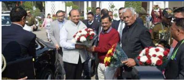
हंगामे के बाद अभिभाषण फिर शुरू कर रही है।