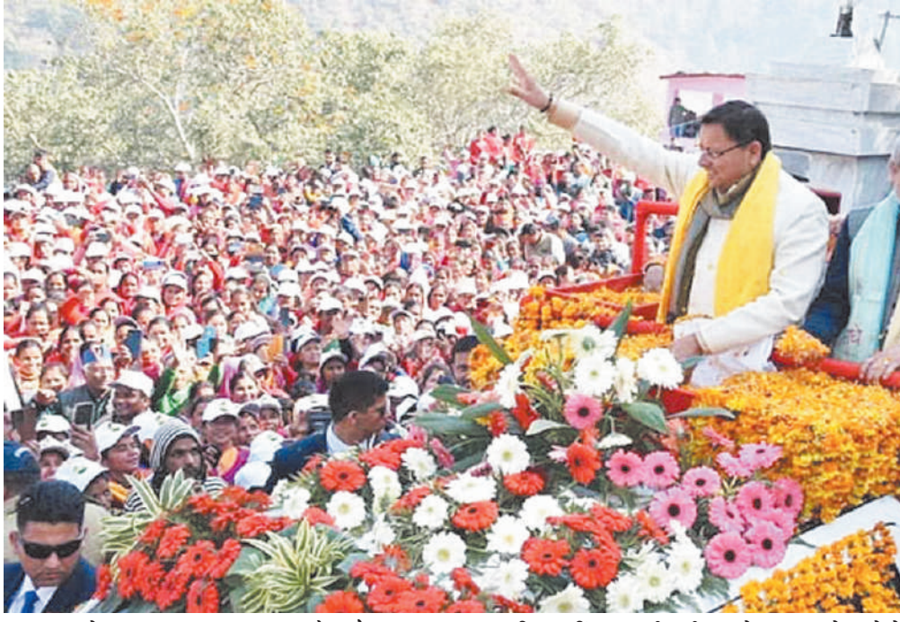
जमकर झूमे। विभिन्न स्कूलों की छात्राओं के अलावा महिलाओं ने सीएम धामी का स्वागत किया। विभिन्न तरह के ढोल-नगाड़ों की टीमों ने रोड शो

बता दें, कुछ पहले मुख्यमंत्री पुष्कर सिंह धामी ने हरिद्वार में भी मातृशक्ति महोत्सव कार्यक्रम में शिरकत करने से पहले शहर में रोड शो निकाला। बड़ी संख्या में कार्यकर्ता रोड शो में शामिल हुए और ढोल-नगाड़ों की थाप पर