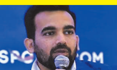
का दबदबा होगा। इंग्लैंड के पूर्व बल्लेबाज ओवैस शाह भी जहीर से सहमत दिखे।

नई दिल्ली। पूर्व भारतीय तेज गेंदबाज जहीर खान का मानना है कि राजकोट की पिच हैदराबाद और विशाखापत्तनम की पिच के समान होगी जिससे एक बार फिर रिवर्स स्विंग की भूमिका होगी। जसप्रीत बुमराह ने विशाखापत्तनम में रिवर्स स्विंग का शानदार नजारा पेश करते हुए मैच में नौ विकेट चटकाए जिससे भारत ने दूसरा टेस्ट जीतकर 5 टेस्ट की श्रृंखला 1-1 से बराबरी की। जहीर ने कहा कि उम्मीद करता हूँ कि पिच हैदराबाद और विशाखापत्तनम की तरह ही होगी। इस तरह की पिच पर शुरूआती दो दिन बड़े और गेंद के बीच अच्छे मुकाबला दिखना चाहिए और फिर तीसरे दिन से स्पिन की भूमिका होगी। जहीर ने कहा कि आपको कुछ रिवर्स स्विंग भी दिखेंगी। और चौथे तथा पांचवें दिन स्पिनरों