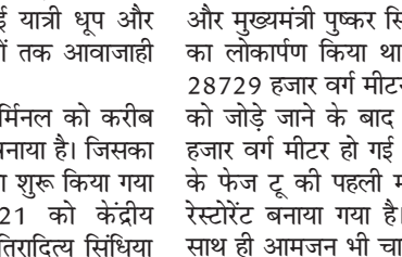
एयरपोर्ट टर्मिनल फेज टू का शुभारंभ बीते शुक्रवार को किया जाना प्रस्तावित था।

देहरादून, एजेंसी। एयरपोर्ट टर्मिनल फेज टू का शुभारंभ बीते शुक्रवार को किया जाना प्रस्तावित था। लेकिन मुख्यमंत्री की व्यस्तता के कारण अब बुधवार को शुभारंभ किया जाएगा। मुख्यमंत्री पुष्कर सिंह धामी बुधवार को देहरादून एयरपोर्ट टर्मिनल फेज टू बिल्डिंग का शुभारंभ करेंगे। उनके साथ दिल्ली से वरचुंअल केंद्रीय नागरिक उड्डयन मंत्री ज्योतिरादित्य सिंधिया भी जुड़ेंगे। फेज टू के निर्माण के बाद टर्मिनल 10 गुना बड़ा हो गया है। एयरपोर्ट टर्मिनल फेज टू का शुभारंभ बीते शुक्रवार को किया जाना प्रस्तावित था। लेकिन मुख्यमंत्री की व्यस्तता के कारण अब बुधवार को शुभारंभ किया जाएगा। जिसके बाद फेज वन बिल्डिंग को प्रस्थान और फेज टू को आगमन के लिए इस्तेमाल किया जाएगा। नई बिल्डिंग में चार एयरोब्रिज भी बनाए गए हैं। जिससे हवाई यात्री धूप और बारिश से बचते हुए विमानों तक आवाजाही कर सकेंगे। फेज वन और टू के टर्मिनल को करीब 460 करोड़ की लागत से बनाया है। जिसका करीब दो साल पहले निर्माण शुरू किया गया था। आठ अक्टूबर 2021 को केंद्रीय नागरिक विमानन मंत्री ज्योतिरादित्य सिंधिया