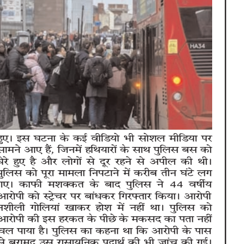
हूए। इस घटना के कई वीडियो भी सोशल मीडिया पर सामने आए हैं, जिनमें हथियारों के साथ पुलिस बस को घेरे हुए है और लोगों से दूर रहने से अपील की थी। पुलिस को पूरा मामला निपटाने में करीब तीन घंटे लग गए। काफी मशक्कत के बाद पुलिस ने 44 वर्षीय आरोपी को स्ट्रेचर पर बांधकर गिरफ्तार किया। आरोपी नशीली गोलियां खाकर होश में नहीं था। पुलिस को आरोपी की इस हरकत के पीछे के मकसद का पता नहीं चल पाया है। पुलिस का कहना था कि आरोपी के पास से बरामद उस रासायनिक पदार्थ की भी जांच की गई।

लंदन, एजेंसी दक्षिण लंदन में सनसनीखेज घटना सामने आई। यहां नशे में धुत एक शख्स बस में सिगरेट फूंक रहा था। जब उसे यात्रियों ने ऐसा करने से रोका तो उसने जेब से एक शीशी निकाल ली और उसमें एसिड होने की बात कहकर इससे हमला करने की धमकी देने लगा। बस यात्रियों से खचाखच भरी थी। घटना उस वक्त काफी बिगड़ गई और अफरा-तफरी का माहौल पैदा हो गया। मेट्रोपॉलिटन पुलिस के अनुसार, 44 वर्षीय व्यक्ति ने ब्रिक्सटन और क्रॉयडन के बीच चलने वाली एक बस में यात्रियों को एसिड से हमला करने की धमकी दी। घटना रिवियर रात की है, जब वह बस में चढ़ा। बस पर चढ़कर वह धूम्रपान कर रहा था। जब यात्रियों ने उसका विरोध किया तो स्थिति बलबल गई। बताया जा रहा है कि आरोपी नशे में चूर था। यात्रियों ने जब उसे धूम्रपान करने से रोका तो उसने जेब से एक शीशी निकाल ली और दावा किया कि उसके अंदर एसिड है। आरोपी यात्रियों पर एसिड अटैक की धमकी देने लगा। मामले में मेट्रोपॉलिटन पुलिस अधिकारियों ने बताया कि उसके की जानकारी हमें देर रात 10.30 के बाद मिली। हम तुरंत पेंकिटव हूए और एंबुलेंस समेत पुलिस बल के साथ मौके के लिए रवाना