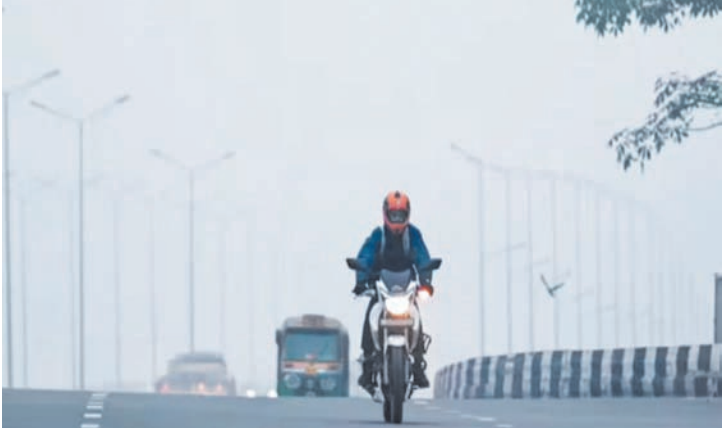
वहीं, पश्चिम बंगाल, सिक्किम, असम, मेघालय, नागालैंड, मिजोरम, मणिपुर और त्रिपुरा में भी बारिश के आसार बन रहे हैं। आईएमडी ने कहा है कि 9-11 फरवरी के

नई दिल्ली, एजेंसी। पंजाब, हरियाणा, चंडीगढ़, दिल्ली, उत्तराखंड के मैदानी इलाकों के साथ-साथ उत्तरी राजस्थान और उत्तर-पश्चिमी उत्तर प्रदेश के अधिकांश हिस्सों में न्यूनतम तापमान 6-10 डिग्री सेल्सियस के बीच रहा। यह सामान्य से नीचे है। राजस्थान के बाकी हिस्सों, पूर्वी उत्तर प्रदेश, बिहार और मध्य प्रदेश के कई हिस्सों में तापमान 11-16 डिग्री सेल्सियस के बीच रहा। यह सामान्य से 4-6 डिग्री सेल्सियस अधिक है। आईएमडी ने अपने ताजा रिपोर्ट में बताया है कि एक चक्रवाती परिसंचरण पश्चिम बंगाल और निचले क्षोभमंडल स्तर पर स्थित है।