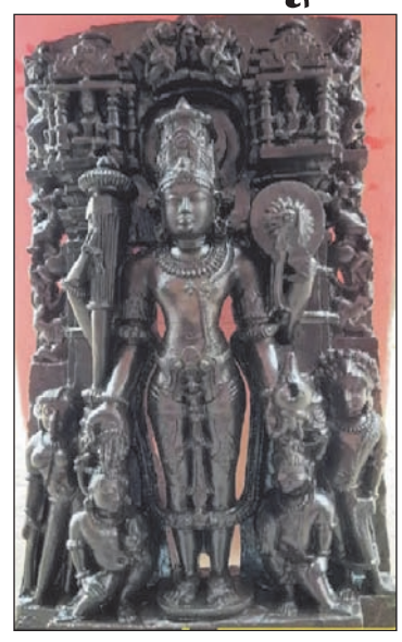
अलंकृत हैं। विष्णु की खड़ी प्रतिमा के चार हाथ हैं, जिसमें दो ऊपर उठे हाथ शंख और चक्र से सुसज्जित हैं। नीचे की ओर सीधे किए दो हाथ आशीर्वाद की मुद्रा में हैं। इनमें एक कटि हस्त और दूसरा वरद हस्त है। हालांकि, इस विग्रह पर गरुड़ का चित्रण नहीं है। जबकि आमतौर पर विष्णु प्रतिमा में गरुड़ भी होते हैं। यह विग्रह ग्रंथों में उल्लिखित भगवान वेङ्कटेश्वर से मिलती-जुलती है। देसाई ने इंगित किया कि विष्णु जी को साज-सज्जा पसंद है इसलिए उन्हें मालाओं और आभूषणों से अलंकृत किया गया है।

रायचूर, एजेंसी। कर्नाटक के रायचूर जिले के एक गांव में कृष्णा नदी से भगवान विष्णु की एक प्राचीन प्रतिमा मिली है। राम लला की नवनिर्मित प्रतिमा से मिलता हुआ यह प्राचीन विग्रह पुरातत्ववेत्ताओं के अनुसार 11वीं या 12वीं शताब्दी का हो सकता है। भगवान विष्णु की इस खड़ी प्रतिमा के प्रभामंडल के चारों ओर दशावतारों को उकेरा गया है।