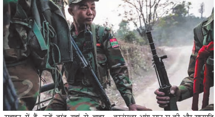
रखाइन में हैं, उन्हें तुरंत वहां से बाहर निकलने की सलाह दी जाती है। रखाइन प्रांत और कई अन्य क्षेत्रों में अक्टूबर 2023 से जातीय समूहों और म्यांमार की सेना के बीच गंभीर लड़ाई देखी गई है। दरअसल, फरवरी 2021 में म्यांमार में सेना ने लोकतांत्रिक सरकार को हटाकर सस्ता पर कब्जा कर लिया। वहां की स्टे

म्यांमार एजेंसी। म्यांमार में हिंसा और तनाव के बीच भारतीय विदेश मंत्रालय वहां रहने वाले भारतीयों के लिए एक एडवाइजरी जारी की है। इसमें भारतीय नागरिकों को वहां के रखाइन प्रांत की यात्रा नहीं करने के लिए कहा गया है। मंत्रालय की ओर से यह भी कहा गया कि रखाइन प्रांत में रह रहे भारतीय फौन किसी सुरक्षित जगह चले जाएं। विदेश मंत्रालय ने अपनी एडवाइजरी में कहा- बिगड़ती सुरक्षा स्थिति, लैंडलाइन समेत कम्युनिकेशन के अन्य साधनों की स्थिति बिगड़ रही है। जर्करी सामान की कमी भी हो रही है। इसे देखते हुए सभी भारतीय नागरिकों को सलाह दी जाती है कि वे म्यांमार के रखाइन प्रांत की यात्रा न करें। जो भारतीय नागरिक पहले से ही