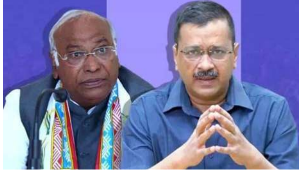
लोकसभा की सात सीटों को लेकर बात बनती दिख रही है। समाचार एजेंसी एएनआई ने कांग्रेस सूत्र के हवाले से बताया कि दिल्ली में सीट

● आप और कांग्रेस दिल्ली के लिए 4-3 फॉर्मूले पर काम कर रहे हैं। हालांकि अभी तक इसकी आधिकारिक पुष्टि नहीं हो सकी है