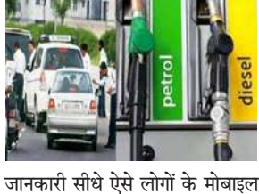
जानकारी सीधे ऐसे लोगों के मोबाइल पर भेजी जा रही है। वैध पीयूसी नहीं होने पर वाहनों के 10-10 हजार रुपये के चालान काटे जाते हैं। दिल्ली के 11 जिलों के लिए है यह व्यवस्था-दिल्ली भर में 950 स्थानों पर पीयूसी प्रमाणपत्र जारी किया जाता है। लगभग सभी पेट्रोल पंपों पर भी यह सुविधा उपलब्ध है। राजधानी के 11 जिलों में से हर जिले में कम से कम दो पेट्रोल पंपों पर विशेष कैमरे लगाए गए हैं। कुछ जिलों में तीन, पेट्रोल पंपों पर यह व्यवस्था की गई है। विभाग के एक वरिष्ठ अधिकारी ने कहा कि इन 25 पेट्रोल पंपों की लोकेशन को

अगर आप के वाहन का पीयूसी प्रमाणपत्र नहीं है तो अब बच नहीं पाएंगे, परिवहन विभाग ने ऐसे वाहनों का चालान काटने के लिए दिल्ली के 25 पेट्रोल पंपों पर विशेष तरह के कैमरे लगा दिए हैं। तुरंत बनवा लें पीयूसी प्रमाणपत्र- कैमरे वाहन की नंबर प्लेट पढ़कर यह पता लगा लेंगे कि आप के वाहन का पीयूसी प्रमाणपत्र वैध है या नहीं, अगर वैध नहीं है तो आपके मोबाइल पर तुरंत संदेश आ जाएगा कि आप का पीयूसी प्रमाणपत्र वैध नहीं है, तुरंत इसे बनवा लें। अगर आप फिर भी नहीं बनवाते हैं तो तीन घंटे समय देने के बाद आप का चालान काट दिया जाएगा। ट्राल के तौर पर यह व्यवस्था पिछले सोमवार से शुरू हो गई है। विभाग ने वाहनों में वैध पीयूसी नहीं होने पर सोमवार से ई-चालान काटने की कार्यवाही शुरू कर दी है। चालान की