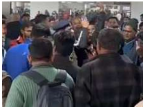
आज सुबह विजिबिलिटी का स्तर ज़ीरो तक पहुंच गया था। इसके चलते कई फ्लाइट्स की उड़ान प्रभावित और कई को रद्द किया गया है। घने कोहरे के चलते 50 से ज्यादा उड़ानें प्रभावित-दिल्ली के आईजीआई एयरपोर्ट के पास बुधवार को भीषण कोहरे के कारण

दिल्ली के इंदिरा गांधी हवाई अड्डे के टर्मिनल 2 से बुधवार सुबह 11 बजे देवघर के लिए उड़ान भरने वाली इंडिगो की फ्लाइट कैसिल कर दी गई। इससे नाराज यात्रियों ने एयरपोर्ट पर हंगामा काट दिया। यात्रियों ने एयरलाइन के खिलाफ नारे लगाए और विरोध प्रदर्शन किया। समाचार एजेंसी एएनआई की ओर से जारी वीडियो में एयरपोर्ट पर यात्रियों को एयरलाइन के खिलाफ हाथ-हाथ के नारे लगाते हुए देखा जा रहा है। बता दें कि आईजीआई एयरपोर्ट पर घने कोहरे की वजह से