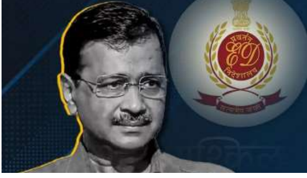
आबकारी घोटाले मामले में ईडी ने मुख्यमंत्री अरविंद केजरीवाल के पास बुधवार को पांचवां समन भेजा है। उन्हें दो फरवरी को बुलाया गया है। आबकारी घोटाले से संबंधित मनी लॉन्ड्रिंग के मामले में पूछताछ के लिए उन्हें बुलाया गया है। इससे पहले दो नवंबर, 21 दिसंबर और तीन जनवरी और 18 जनवरी को चार समन पर ईडी के सामने पेश होने से इनकार कर दिया था और समन को अवैध और राजनीति से प्रेरित बताया था कि जरीवाल ने ईडी की कार्यवाही पर भी सवाल उठाया था, उन्होंने समन पर कानूनी आपत्तियों का हवाला दिया था और एजेंसी पर

न्यायाधीश, जूरी और जल्लाद की भूमिका निभाने का आरोप लगाया था। इस बार भी केजरीवाल ईडी के सामने पेश होंगे, इसकी संभावना कम है। पहले चार बार भेजे जा चुके हैं समन-अरविंद केजरीवाल को पिछले हफ्ते चौथी बार ईडी ने समन जारी किया था और 18 जनवरी को एजेंसी के सामने पेश होने को कहा था। बता दें कि केजरीवाल ने इससे पहले दो नवंबर और 21 दिसंबर और तीन जनवरी के तीन समन पर ईडी के सामने पेश होने से इनकार कर दिया था।