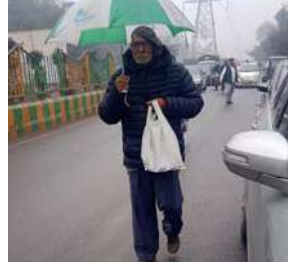
वर्षा और बूंदबांदा के कारण बढ़ी सर्दी- नोएडा में मौसम की उठा-पटक जारी है। बुधवार को मौसम ने पलटी मारी। बुधवार सुबह घना कोहरा छाया रहा। हश्यता लगभग 100 मीटर

दो दिन से सुबह के चक्क काफी ज्यादा कोहरा होने के बाद बुधवार दोपहर में बारिश से दिल्ली-एनसीआर का मौसम बदल गया है। बारिश होने से जहां कोहरे में कमी आई है वहीं टिडरुन भी बढ़ गई। बारिश से पहले आउट सुबह घना कोहरा छाया रहा फिर सुबह 10 बजे तक हल्की धूप निकली। हालांकि दिन चढ़ते-चढ़ते 12 बजे से फिर मौसम बदला और दिल्ली, नोएडा, गाजियाबाद, सोनीपत समेत कई इलाकों में हल्की से तेज बारिश शुरू हो गई। नोएडा में हल्की