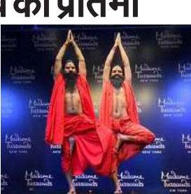
आयुर्वेद एवं स्वदेशी को लेकर जो गतिविधियां पंतजलि की ओर से चलाई जा रही हैं, उसे अब पूरी दुनिया अपना रही है। स्वामी रामदेव ने कहा कि इस प्रतिकृति को बनाने में लगभग 200 कलाकारों का पुरुषार्थ तथा लगभग दो करोड़ रुपये की लागत आई है। यह कास्ट का विषय नहीं है। यह एक कॉन्सेप्ट है। उन्होंने कहा कि सनातन धर्म में व्यक्ति नहीं व्यक्तित्व की पूजा करो, चित्र नहीं चरित्र की पूजा करो।

दिल्ली पहुंचे स्वामी रामदेव ने अपने संदेश में कहा कि मैडम तुसाद म्यूजियम न्यूयॉर्क में 200 से ज्यादा बड़ी हस्तियों के स्टैच्यू लगे हैं। इनमें अमिताभ बच्चन, ऐश्वर्या राय, ऋतिक रोशन, प्रियंका चोपड़ा तथा शाहरुख खान आदि भी शामिल हैं। इनमें शामिल होने पर भारत के एक संन्यासी को जिस गर्व की अनुभूति हो रही है, उससे ज्यादा देशवासियों को है। उन्होंने कहा कि आज पूरी दुनिया की निगाहें भारत के योग व आयुर्वेद पर हैं। अब तो अमेरिका में भी मेड इन यूएस और मेड बाई अमेरिका के सिद्धांत पर कार्य किया जा रहा है। उन्होंने कहा कि योग,