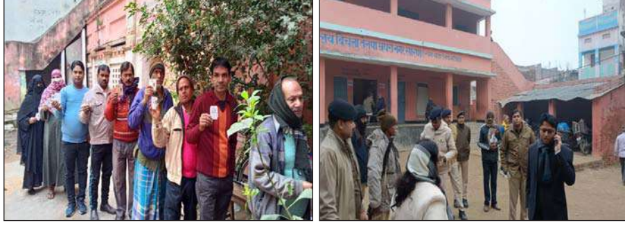
● प्रशासनिक अधिकारी अलर्ट मोड में दिखे, पुलिस बल भी मतदान केंद्रों पर अलर्ट

छपरा। जिलाधिकारी के बेहतर प्रबंधन, चाक-चौबंद सुरक्षा व्यवस्था के बीच नगर निगम मेयर उपचुनाव शांतिपूर्ण माहौल में संपन्न हो गया। मतदान सुबह 7:00 से शुभारंभ हुआ, लेकिन मौसम के बदले मिजाज ने मतदान के प्रतिशत को जरूर बाधित किया, वहीं अयोध्या में भगवान श्रीराम का प्राण प्रतिष्ठा को लेकर भी मतदान के प्रतिशत में कमी आई है, भगवान श्री राम में विश्वास करने वाले समर्थक भी पहले ही अयोध्या जा चुके हैं। जबकि जिला प्रशासन भी मतदान को लेकर चुस्त एवं दुरुस्त दिखी, पुलिस का पेट्रोलिंग गरत भी जारी रहा। प्राप्त जानकारी के अनुसार आयोग द्वारा निर्धारित समय अनुसार अहले सुबह से मतदान शुरू हुआ। सूर्य नहीं निकलने से ठंड अत्यधिक होने के कारण मतदान केंद्रों पर सननाटा छाया रहा। अहले सुबह बूथों पर मतदाताओं की संख्या कम होने के कारण इसका असर मतदान प्रतिशत पर भी पड़ा। शहर के राहत रोड, साहेबगंज, कटरा, आदर्श मतदान केंद्र जिला स्कूल सहित अधिकांश मतदान केंद्रों पर मतदान