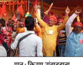
प्रातः किरण संवाददाता

इसुआपुर। अयोध्या में श्री राम मंदिर के प्राण प्रतिष्ठा के मौके पर इसुआपुर में मंदिरों को दुल्हन की तरह बनाया गया है। कई मंदिरों में अखंड अष्टयाम के आयोजन किए गए हैं। वहीं विभिन्न भक्तिमय कार्यक्रमों के आयोजन भी किए गए हैं। मंदिरों के परिसर में अयोध्या में हो रहे कार्यक्रम के लाइव प्रसारण भी दिखाई जा रहे हैं। जहां लोग लाइव प्रसारण को देख रहे हैं। इसुआपुर पंचमंजिला मंदिर से राम लक्ष्मण की झांकी के साथ भव्य शोभा यात्रा निकाली गई। जिसमें शामिल महिला श्रद्धालुओं ने भी बद्ध चढ़कर भाग लिया तथा नृत्य प्रस्तुत करती हुई अपने खुशी का इजहार किया। वासुदेव नगर बेला तथा लौवा मंदिरों से भी शोभायात्रा निकली गई। राम जानकी मंदिर अगोथर पांडेय टोला, हनुमान मंदिर शामकौरिया, हनुमान मंदिर सतासी परिसर में अखंड अष्टयाम के आयोजन किए गए हैं।